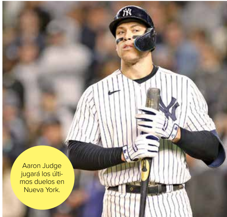
Aaron Judge jugará los últimos duelos en Nueva York.

De los 62 cuadrangulares que lleva en la temporada, 30 de ellos los ha