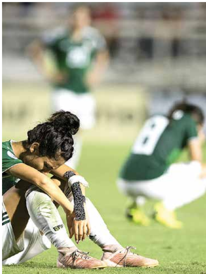
Impotencia y lágrimas entre las jugadoras del Tricolor.