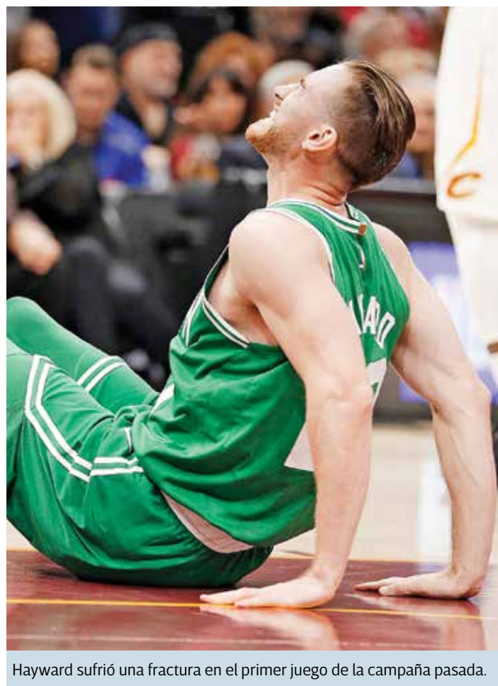
Hayward sufrió una fractura en el primer juego de la campaña pasada.

“He comprendido que es parte de un proceso de adaptación que he tenido que asimilar después de mucho tiempo sin jugar”, dijo el delantero de los Celtics. “Ahora mi cuerpo es el que debe adaptarse otra vez al ritmo de los juegos constantes”.