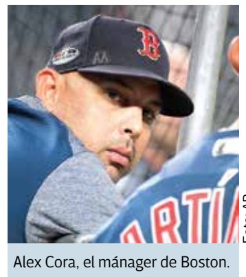
Alex Cora, el mánager de Boston.

Ese liderazgo fue lo que convenció a los Medias Rojas hace un año, cuando decidieron ofrecerle el puesto de mánager tras ser coach de banca de Houston, equipo que ganó la Serie Mundial y al que desde el sábado enfrentará en la Serie de Campeonato de la Liga Americana.