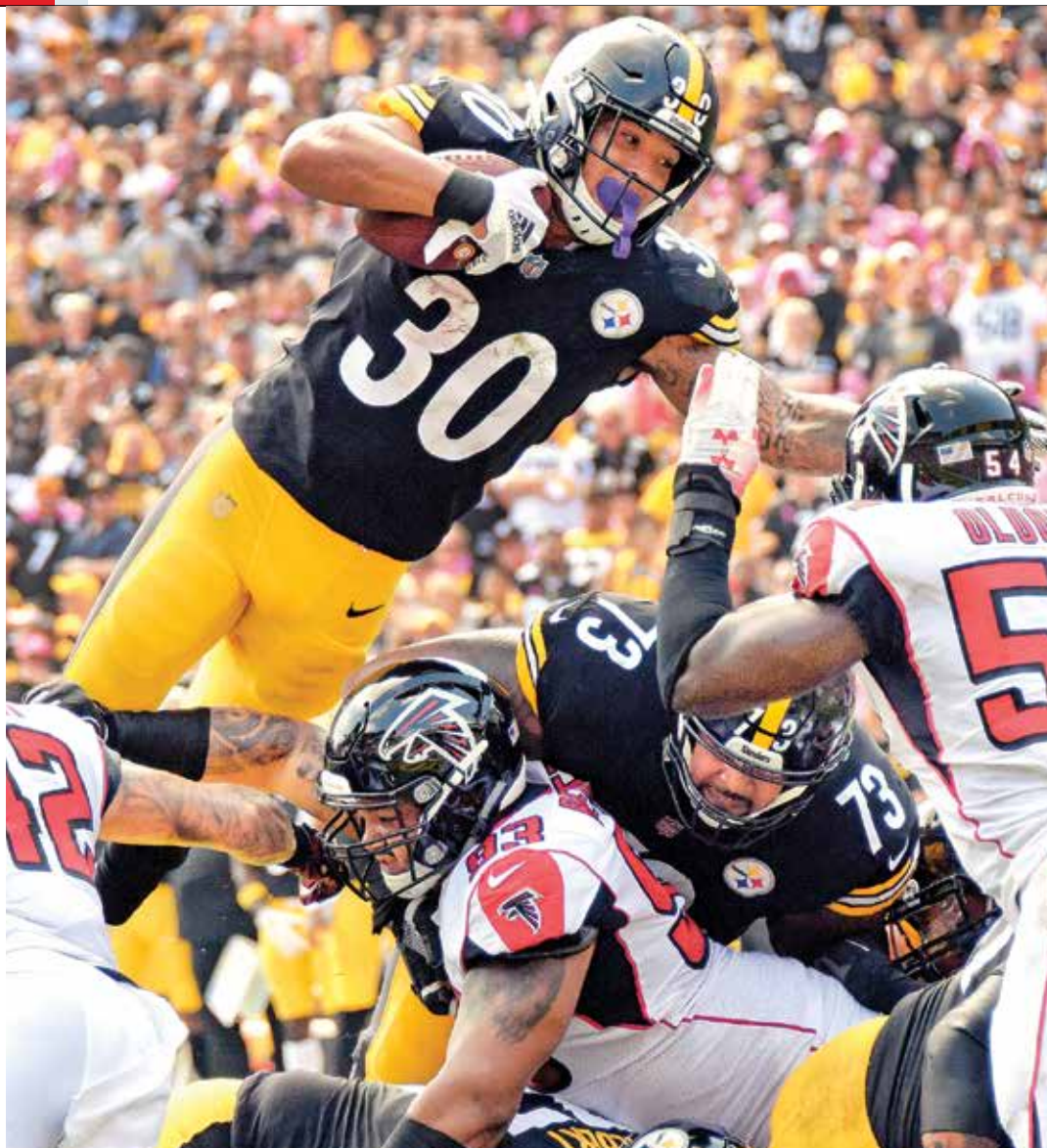
James Conner se ha ganado un lugar como corredor titular con los Acereros de Pittsburgh.