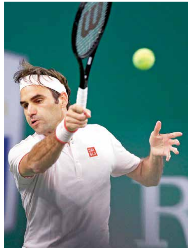
Federer busca conservar el segundo peldaño del escalafón de la ATP.

El argentino Juan Martín del Potro también debutó con un triunfo ante el francés Richard Gasquet por 7-5 y 7-6 (9/7). Tres días después de perder la final de Pekín y de batallar con la gripe, Delpo mostró altibajos, pero supo sacar el triunfo.