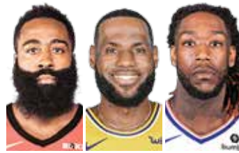
J. HARDEN L. JAMES M. HARRELL