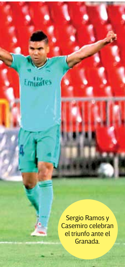
Sergio Ramos y Casemiro celebran el triunfo ante el Granada.