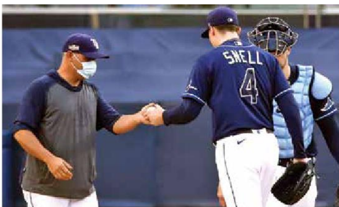
Blake Snell, el gran estelar de los Rays de Tampa Bay, fue el derrotado en el sexto partido por el cetro de la Liga Americana.

"No teníamos opción en ninguno de estos tres juegos, teníamos que salir a ganar, jugando como pudiéramos", dijo Baker. "La clave fue no pensar en el juego de mañana, no pensar que teníamos que