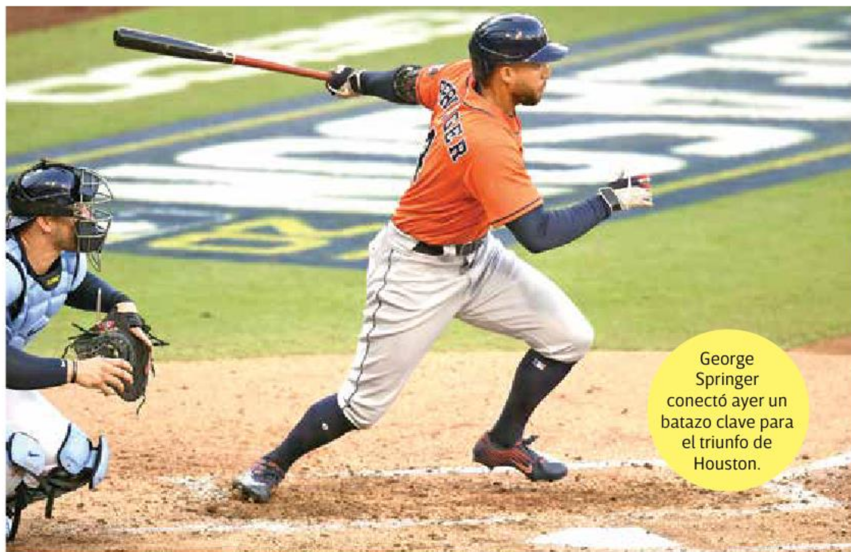
George Springer conectó ayer un batazo clave para el triunfo de Houston.