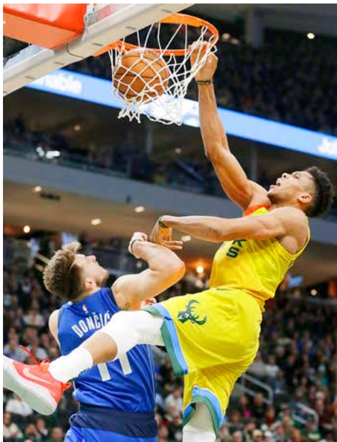
Antetokounmpo terminó con 31 puntos en la victoria de los Bucks.