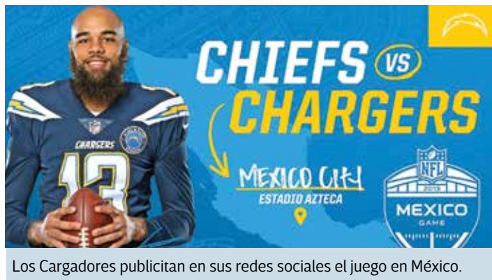
Los Cargadores publicitan en sus redes sociales el juego en México.

Jefes y Cargadores disputarán en el Azteca uno de los duelos internacionales, luego de que se canceló el partido del año pasado