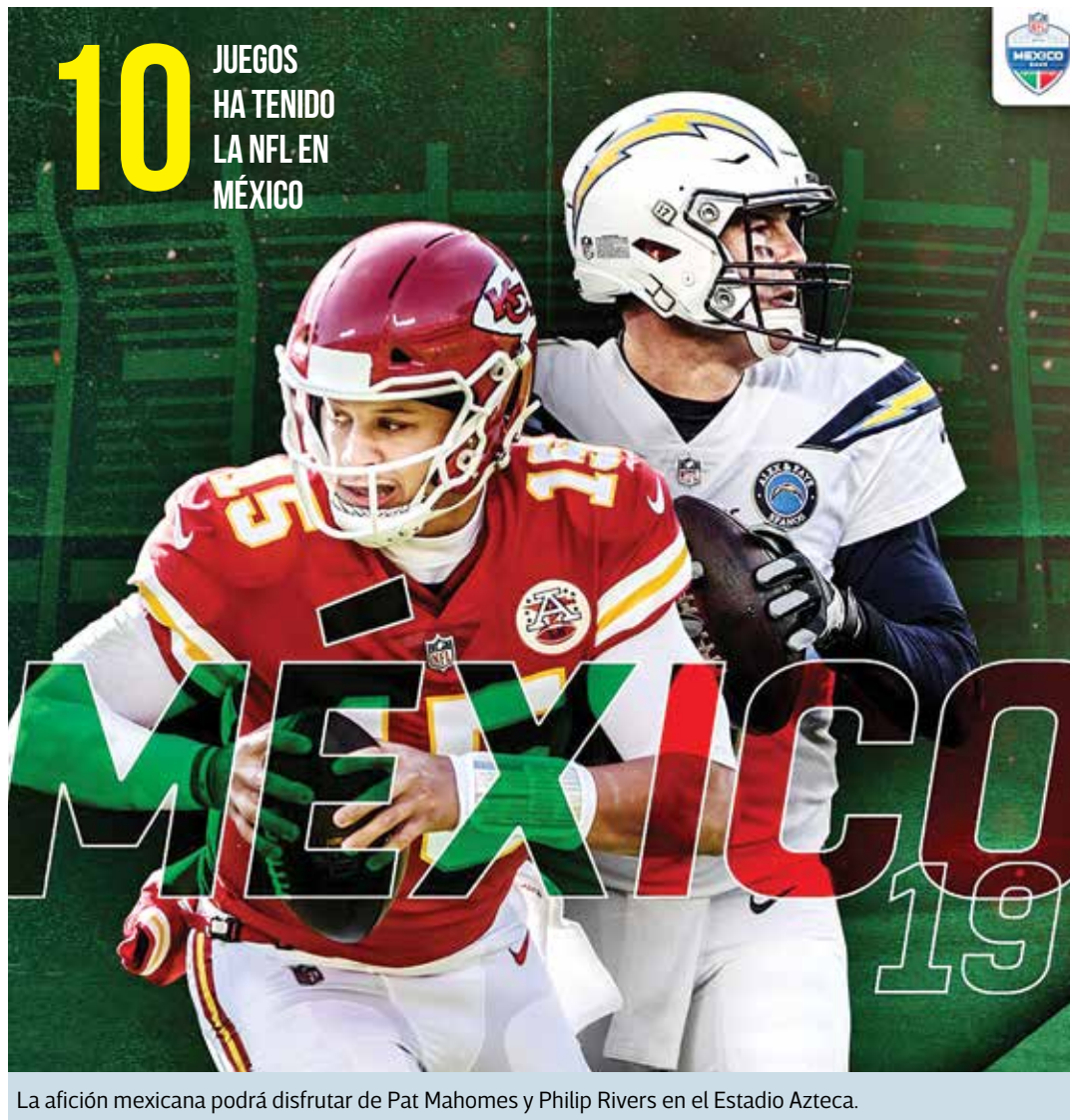
La afición mexicana podrá disfrutar de Pat Mahomes y Philip Rivers en el Estadio Azteca.