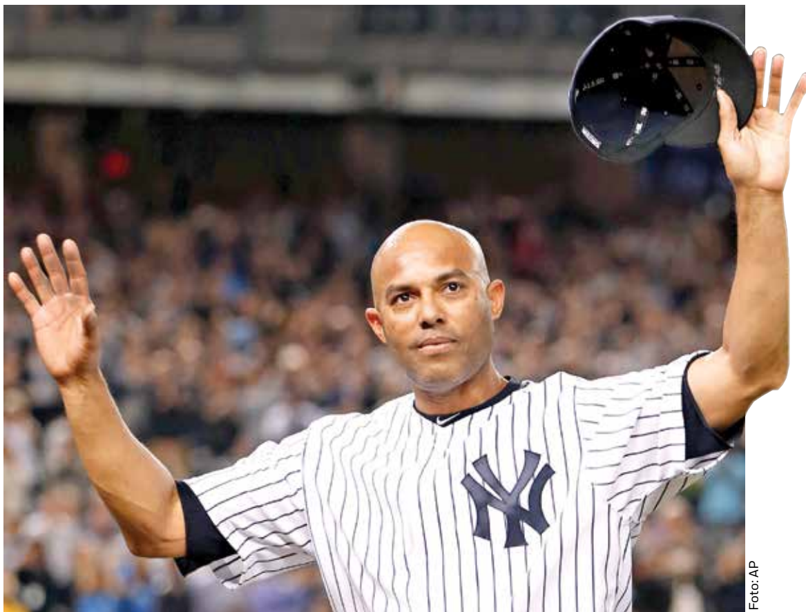
Mariano Rivera es líder de todos los tiempos en salvamentos con 652.

El deporte no es una cápsula hermética. Por el contrario, es la sociedad la que influye más en él, que el deporte en ella.