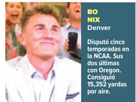
BO NIX Denver

Se encargó de guiar a Michigan a su primer título universitario desde 1997. Tuvo 49 envíos de anotación.