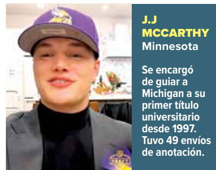
J.J. MCCARTHY Minnesota

Llevó a Washington a la final del campeonato colegial de 2023. Tiene 96 pases de TD en la NCAA.