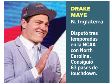
DRAKE MAYE N. Inglaterra

Sumó 12,749 yardas aéreas y 3,307 yardas terrestres. Fue titular en 55 juegos como quarterback de LSU.