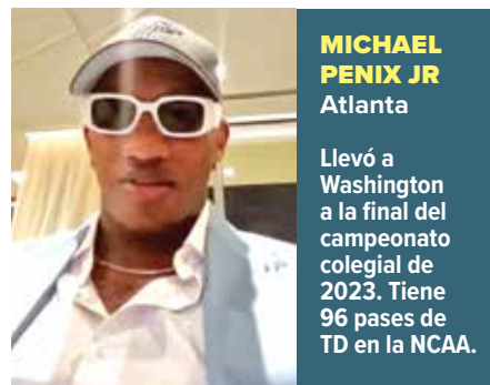
MICHAEL PENIX JR Atlanta

Pero Williams no está solo en esta odisea del draft. Jayden Daniels de LSU encontró un nuevo hogar en los Commanders de Washington, mientras que Drake Maye, Michael Penix