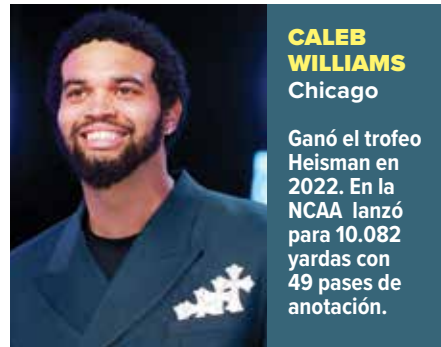
CALEB WILLIAMS Chicago

Los Bears no tardaron en seleccionar anoche a Caleb.