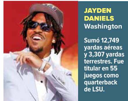
JAYDEN DANIELS Washington

Ganó el trofeo Heisman en 2022. En la NCAA lanzó para 10.082 yardas con 49 pases de anotación.