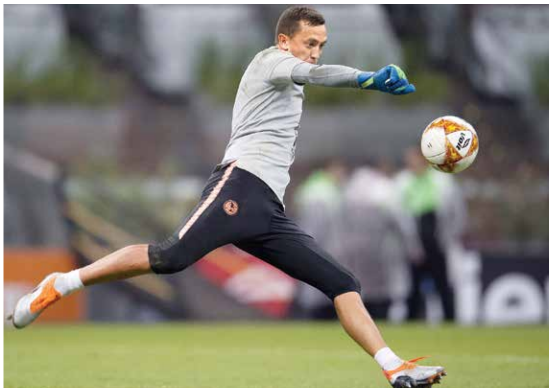
Agustín Marchesín pide tranquilidad a la afición americanista. Promete título y alegrías.