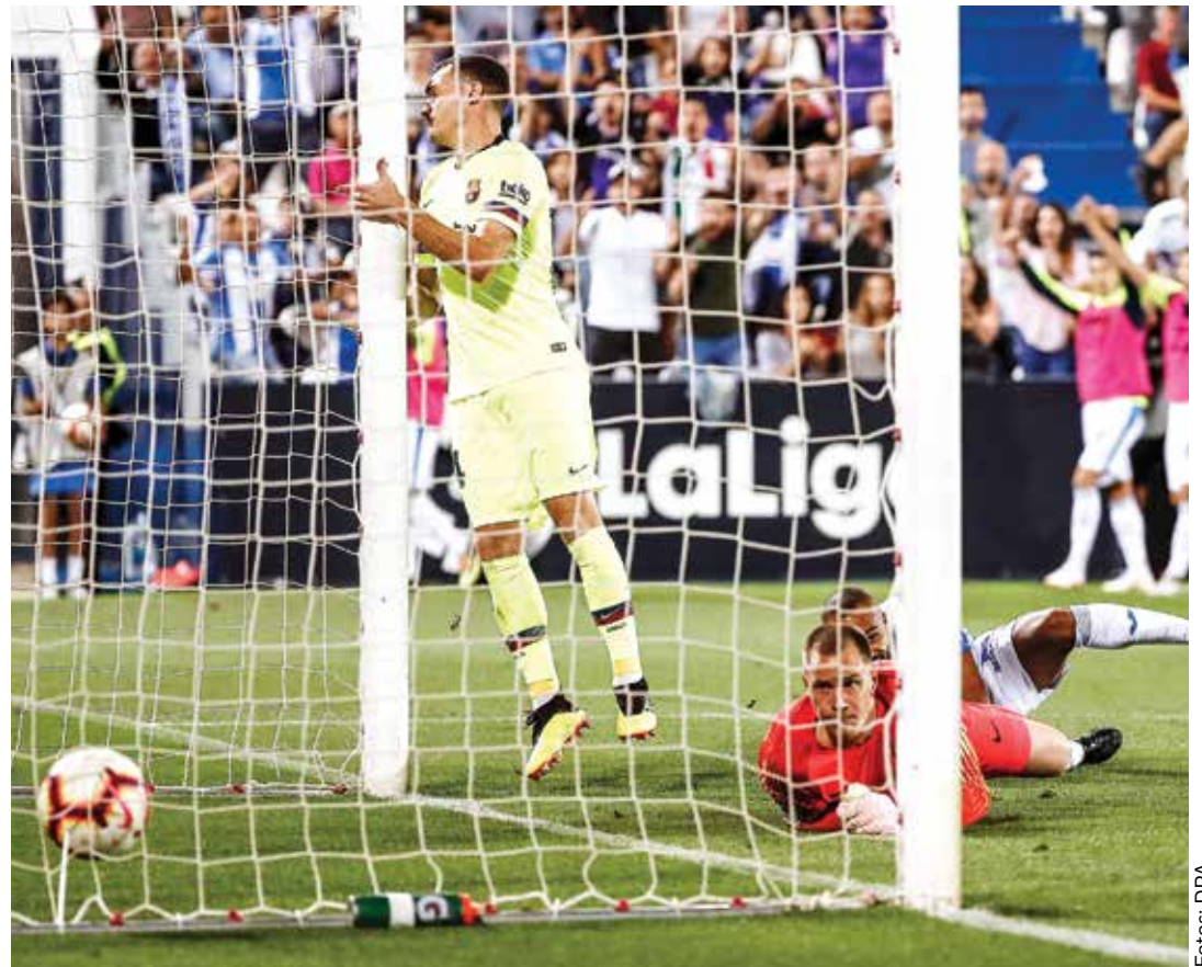
Dos minutos de inspiración (52 y 53) fueron suficientes para que el Leganés sorprendiera al líder blaugrana.

Sacaron de centro los azulgrana, perdieron el esférico y de nuevo se produjo otro envío kilométrico buscando esta vez a En-Nesyri. Se trabó el punta, pero también Piqué, quien despejó hacia el interior del área. Óscar Rodríguez, que había visto la película desde la distancia, interceptó el balón en escorzo y sorprendió al portero.