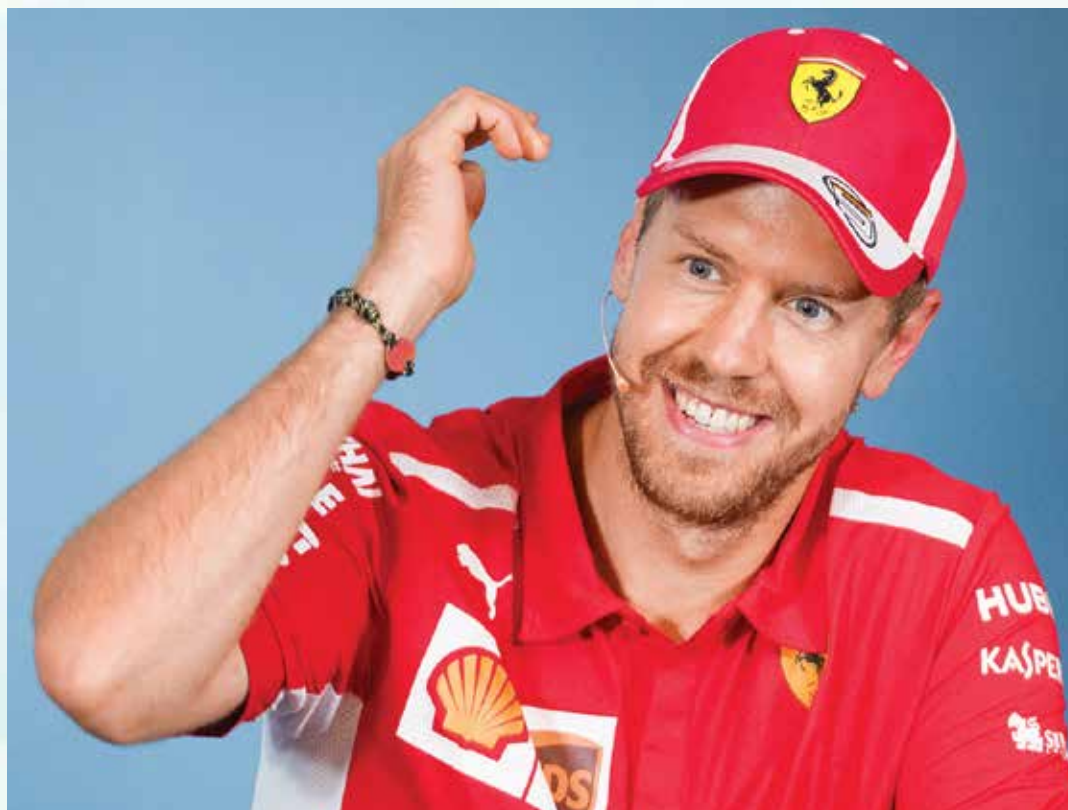
El tetracampeón Sebastian Vettel necesita dar un golpe de autoridad en Sochi este domingo.

“Por supuesto que tengo presión pero la mayor parte del tiempo me la pongo yo mismo. Si sabes de lo que eres capaz y no lo consigues, no estás satisfecho”, expuso el alemán para el diario Auto Bild .