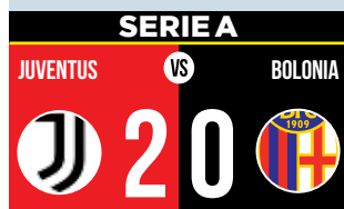
Paulo Dybala se estrena.