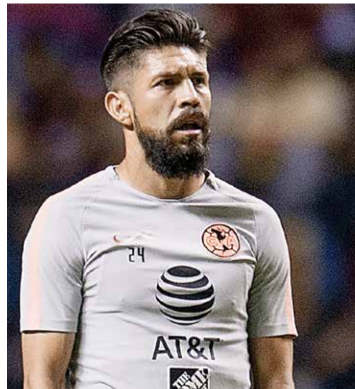
Oribe Peralta se ha convertido en el talismán de Coapa ante las Chivas.