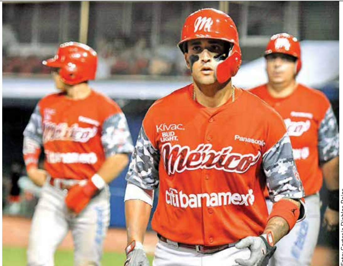
Los pingos montaron una ofensiva de seis carreras en el lapso de la quinta a la séptima entradas.

Nunca en la historia de Las Mayores se han tenido dos duelos de desempate en el mismo año, sobraría decir que mucho menos se ha dado el caso de tres.