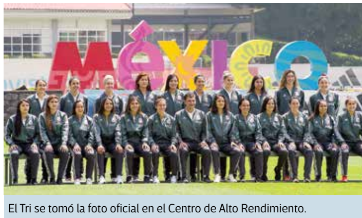
El Tri se tomó la foto oficial en el Centro de Alto Rendimiento.

“Pero para eso trabajamos, para intentar llegar a los niveles a los que ha llegado Estados Unidos y no bajaremos los brazos; para intentar llegar a esos niveles y un día superarlos. Creo tenemos los talentos para poder estar ahí”, sostuvo el estratega.