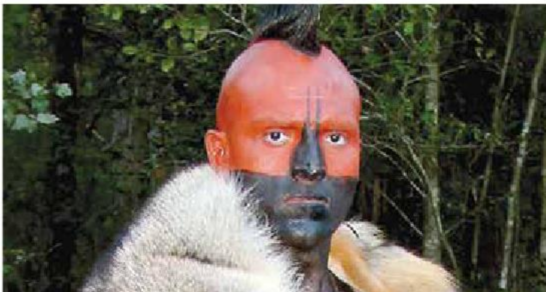
En su participación como actor en la película El Nuevo Mundo , que se filmó en Virginia en 2004 y donde conoció a Emmanuel Lubezki.