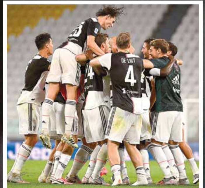
El domingo, la Juventus alzó su noveno título de la Serie A de manera consecutiva.