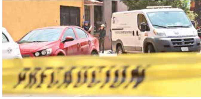
Forenses arribaron a Real del Monte, en la colonia Guadalupe Insurgentes, donde fue asesinada una mujer de unos 60 años.

El primer evento fue reportado ayer alrededor de las 6:00 am; una joven de 21 años fue asesinada a golpes y