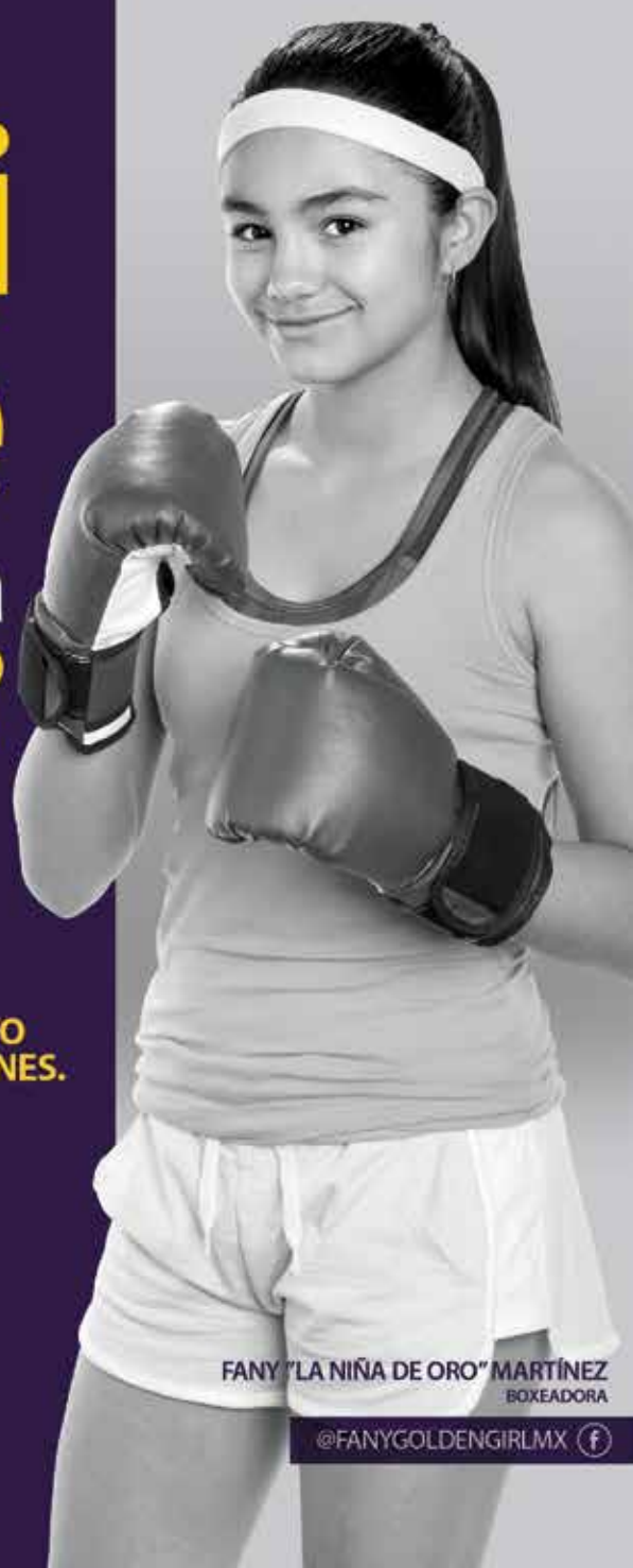
FANY "LA NIÑA DE ORO" MARTÍNEZ BOXEADORA