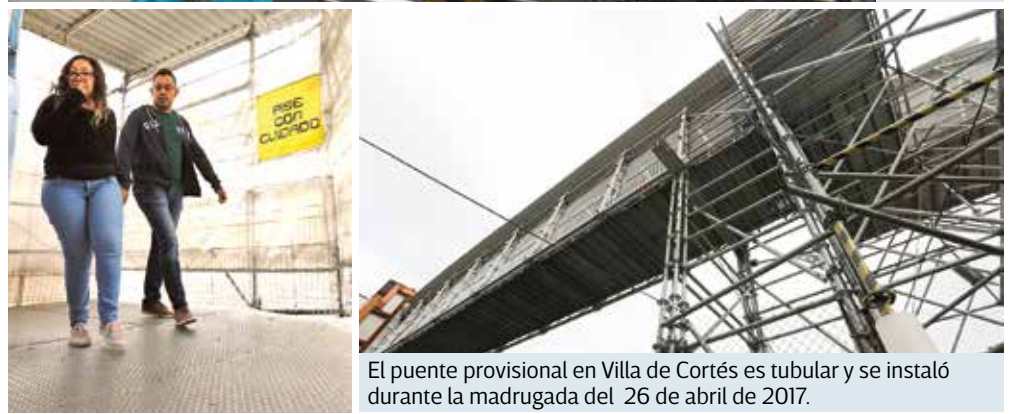
El puente provisional en Villa de Cortés es tubular y se instaló durante la madrugada del 26 de abril de 2017.