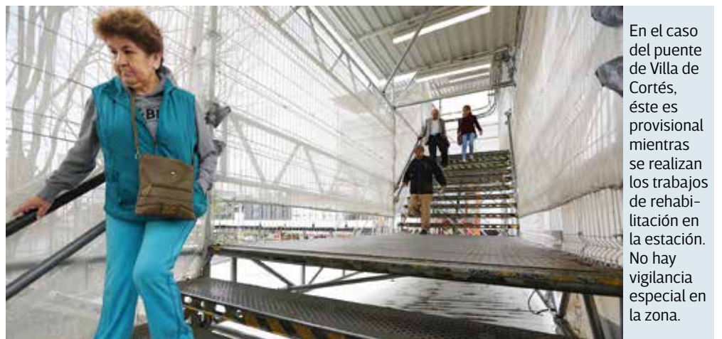
En el caso del puente de Villa de Cortés, éste es provisional mientras se realizan los trabajos de rehabilitación en la estación. No hay vigilancia especial en la zona.

“Las personas mayores batallamos mucho para bajar las escaleras porque los escalones son de diferentes tamaños y no están fijos”, dijo Ismael, de 60 años.