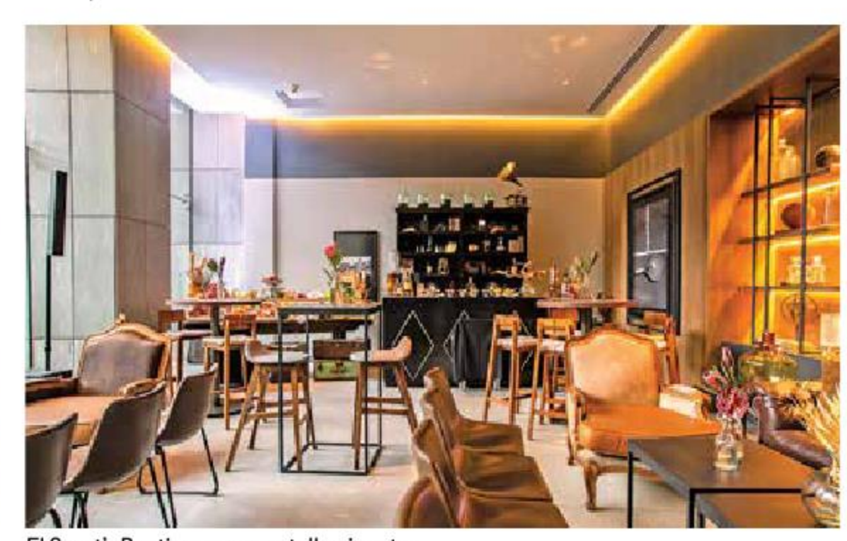
El Sport's Bar tiene una pantalla gigante