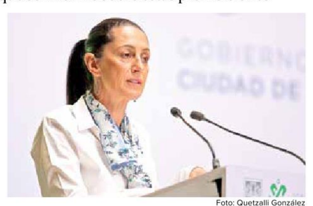
Claudia Sheinbaum envió al Congreso una iniciativa para que la pena por robo de celular sea de uno a tres años de cárcel.

"El objetivo es combatir y disminuir el delito de robo de celular. Además de las patrullas de vigilancia, las cámaras que vamos a instalar en el transporte público (...) tomamos la decisión de dos acciones: una, incrementar