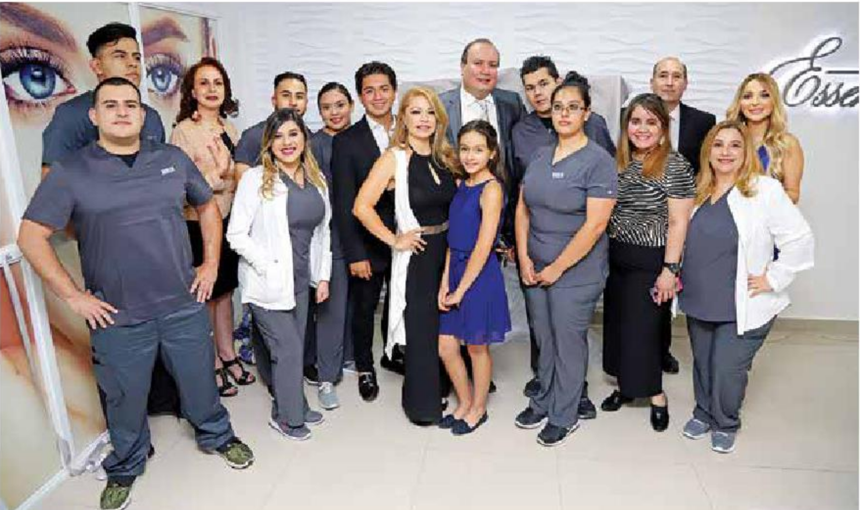
El equipo de trabajo comenzará a laborar con 15 personas altamente certificadas y capacitadas para cada área