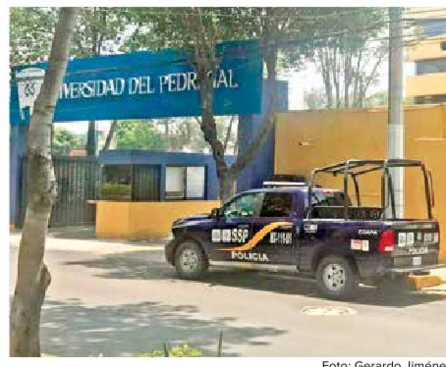
La seguridad se reforzó en el entorno de la Universidad del Pedregal luego de la firma del Sendero Seguro en escuelas privadas.

rosario, me da un abrazo y se suelta llorando con unas ganas y una fuerza, y me dice: 'Señora vine a darle las gracias porque mi hijo es un