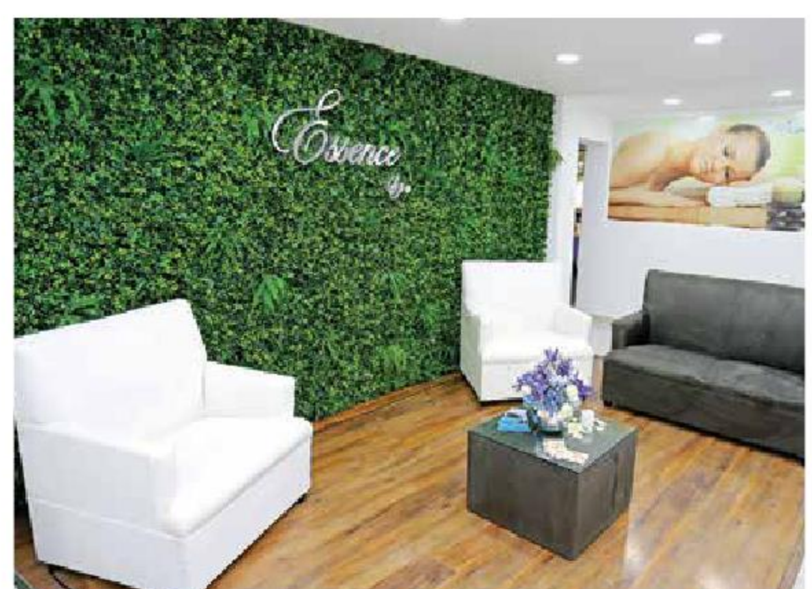
La clínica de belleza integral

tes", mencionó el director. Para más información sobre esta novedosa clínica de belleza integral en la CDMX visita: https://essence-ms.com/