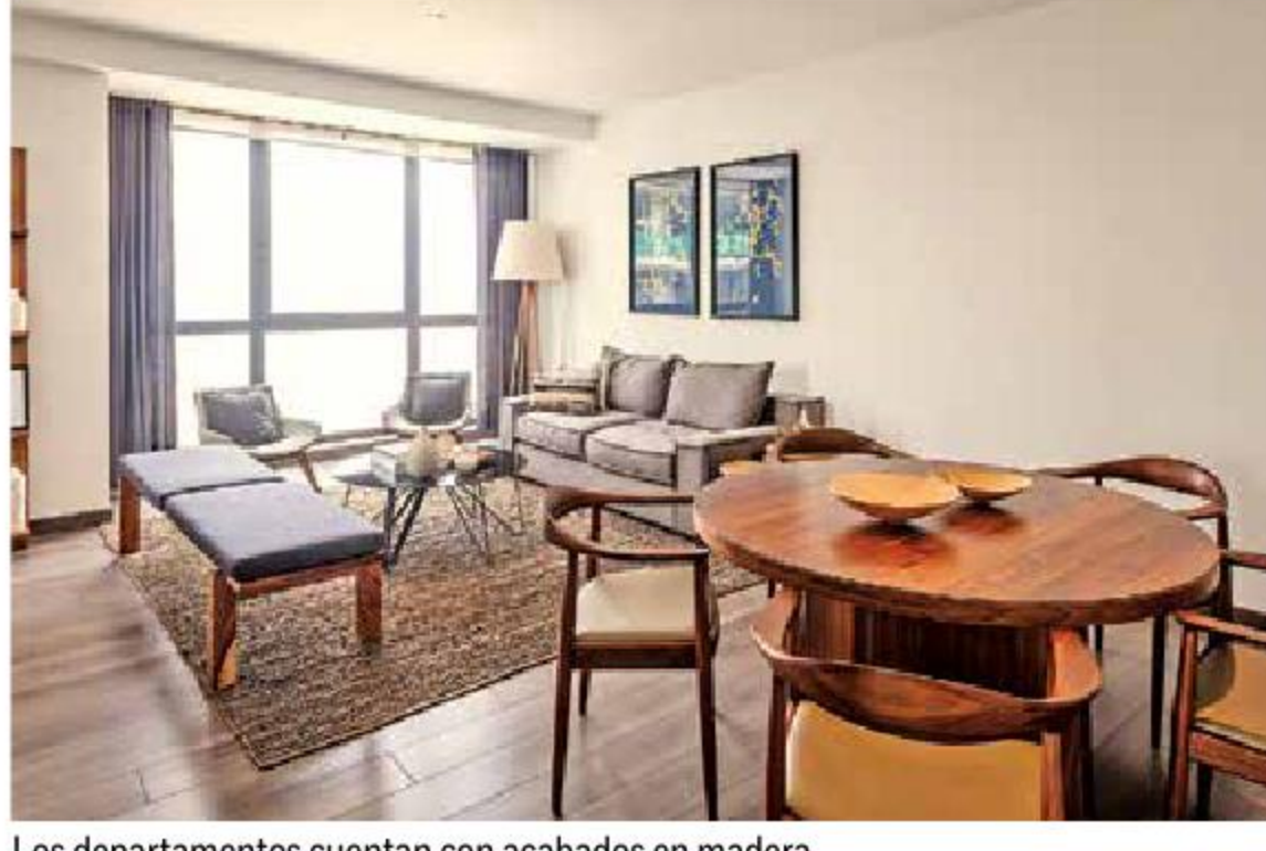
Los departamentos cuentan con acabados en madera

Cuenta con su propia planta para el tratamiento de agua, uso de agua tratada para mantener áreas verdes, reutilización de agua para descargas en los baños de los departamentos, así como diseño window wall con cristal de piso a techo que permite iluminación natural sin incrementar la temperatura en interiores.