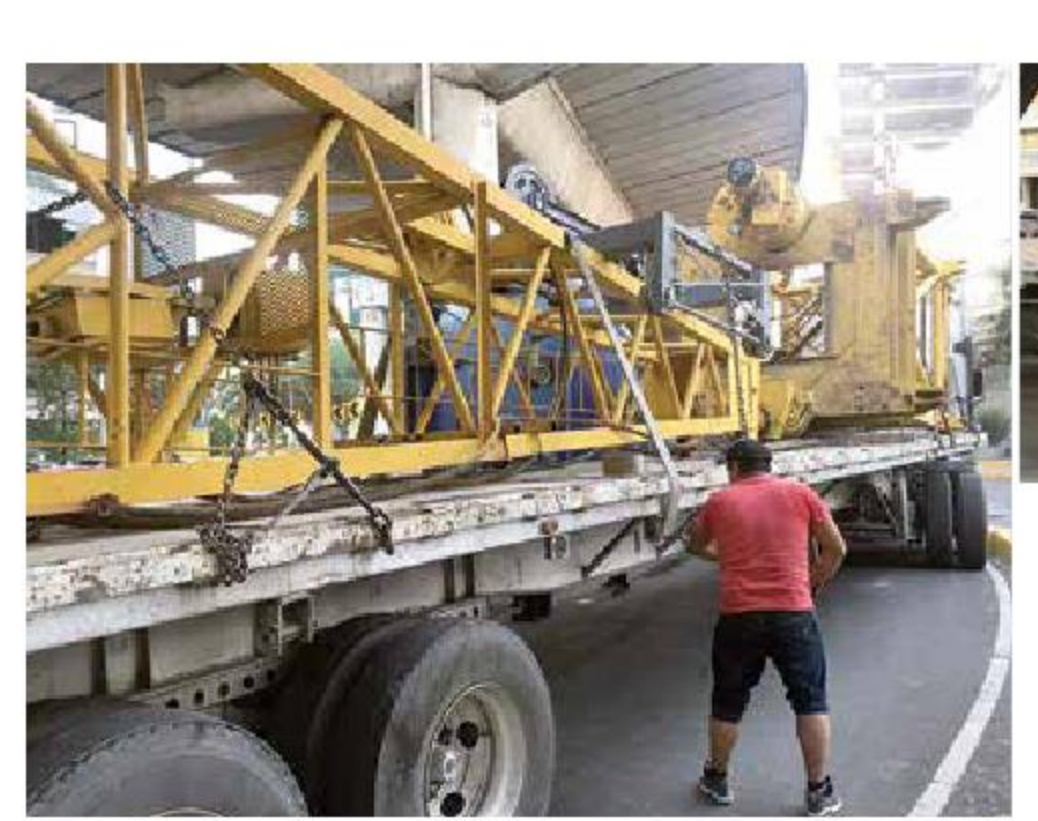
PALMAS V DEDIEÉDICO