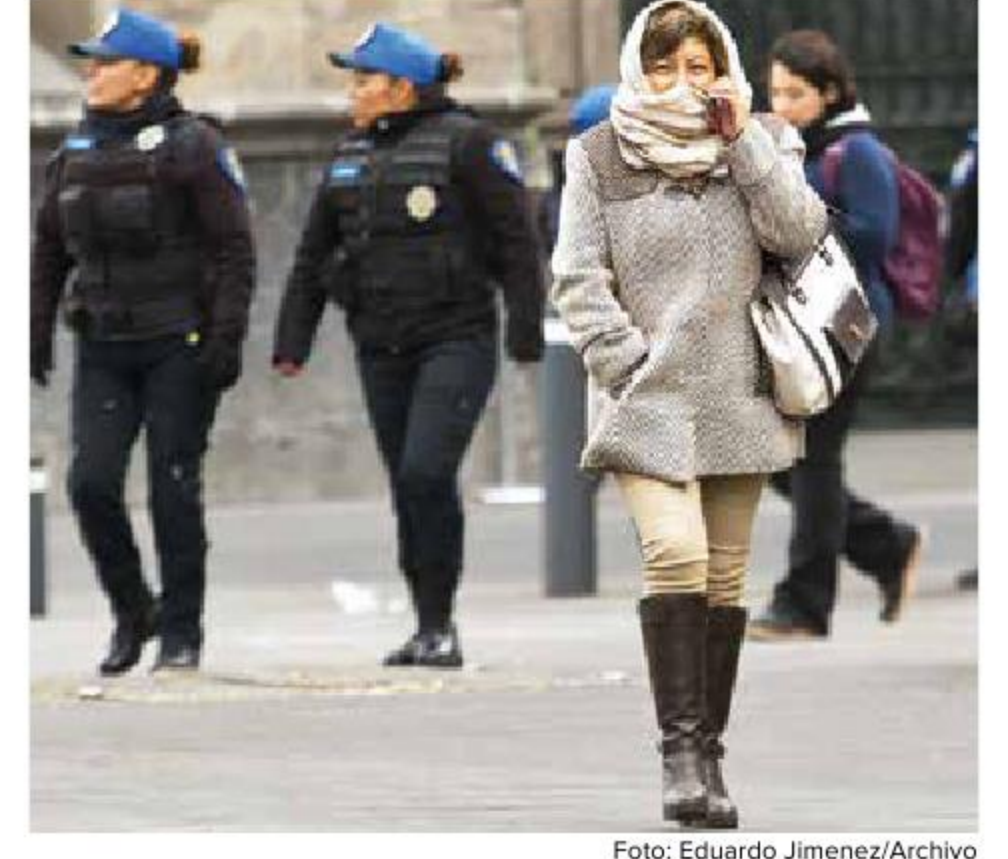
Foto: Eduardo Jimenez/Archivo Hoy las temperaturas más bajas rondarán los 4 grados centígrados.