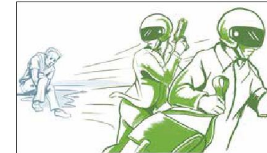
Los asaltantes le dispararon a la víctima y huyeron con el botín.