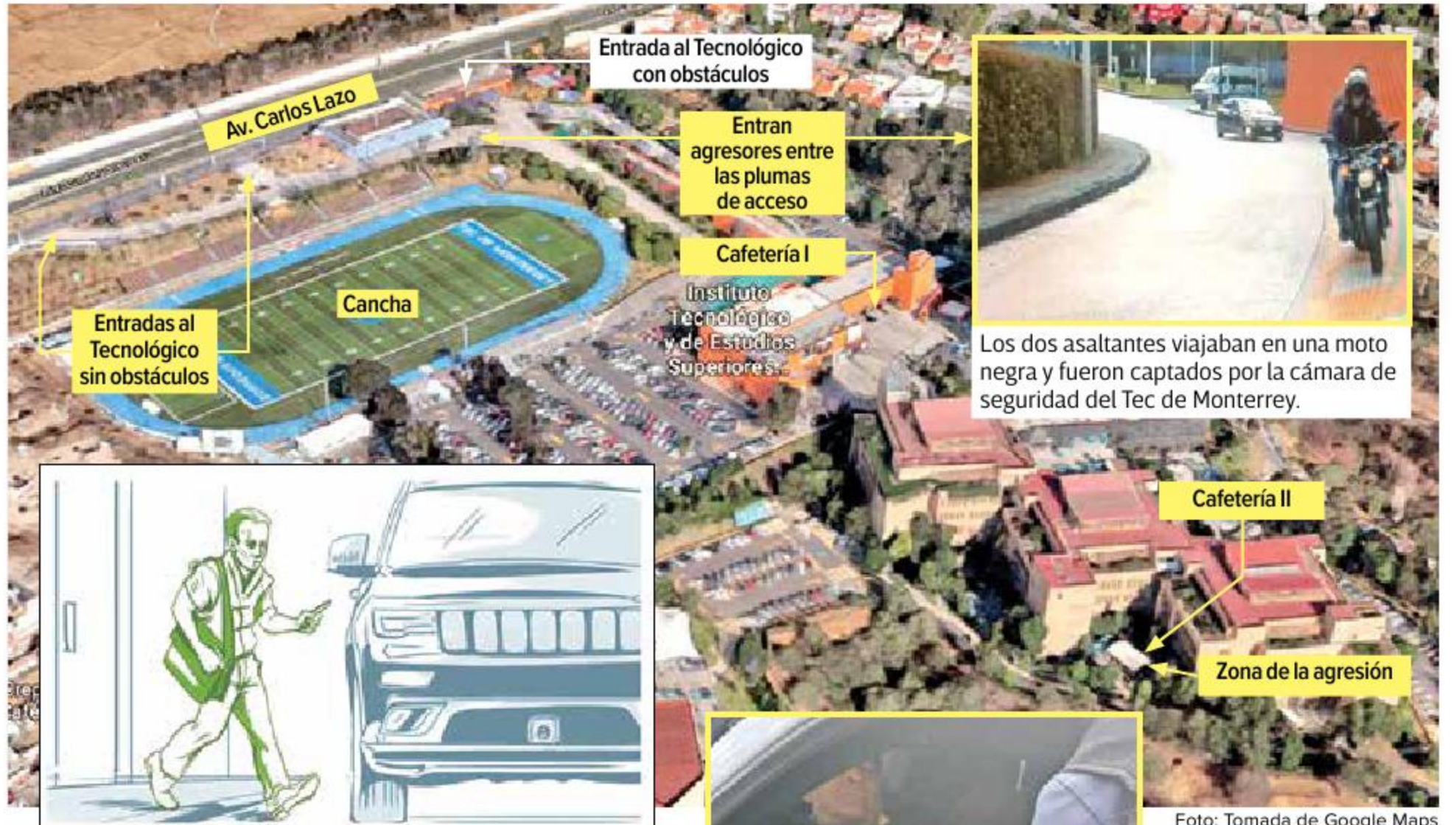
Los dos asaltantes viajaban en una moto negra y fueron captados por la cámara de seguridad del Tec de Monterrey.