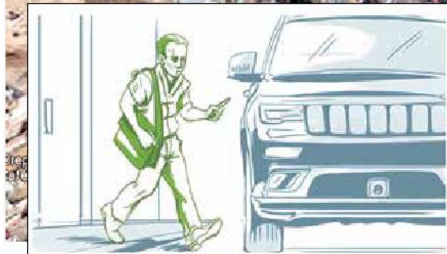
La víctima retiró 45 mil pesos en una sucursal bancaria cercana al Tecnológico de Monterrey Santa Fe.