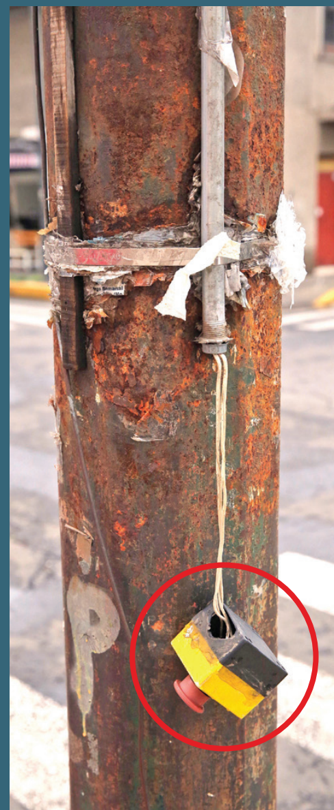
En diversos recorridos, este diario encontró que algunos botones han sido arrancados e, incluso, algunas cámaras de videovigilancia fueron pintadas con aerosol.