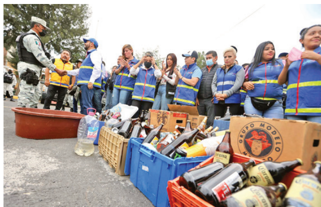
El operativo fue entre la alcaldía, el Instituto de Verificación Administrativa, la Guardia Nacional y Escudo Coyoacán.

Al cierre de esta edición, bomberos y otros elementos de los servicios de emergencia trabajaban para sacar el vehículo del canal.