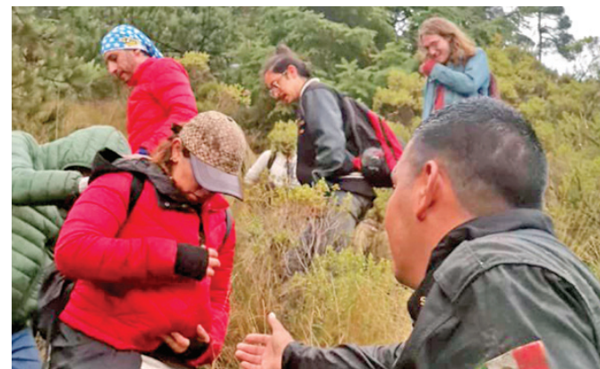
Extraviados en el Circuito Picacho Ajusco en el kilómetro 19+500.

las coordenadas son Long-99.073 lat 19.20752, están conmigo 13 personas entre ellos mi hijo de 12 años”, publicó a las 18:41 horas. Alrededor de las 20:00 horas, la SSC informó que se estaba iniciando el descenso de 13 adultos y un menor de edad a una zona segura, en donde serían atendidos “por los paramédicos para su valoración médica”. García Harfuch reconoció a través de su cuenta de Twitter la labor de los rescatistas y agentes desplegados en el rescate.