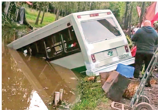
Tres de los lesionados estaban en un puesto de carnitas cuando el microbús los impactó; el cuarto era pasajero de la unidad.

“Un gran esfuerzo de los compañeros de #ERUM y policías de @SSC_CDMX permitió la localización de 13 adultos y un menor de edad extraviados en el #Ajusco, mismos que fueron trasladados a una zona segura para ser atendidos por los paramédicos”, publicó en la red social.