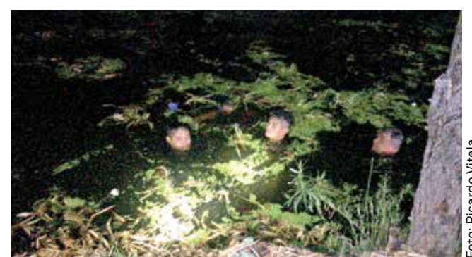
La policía ribereña en el canal buscando al segundo individuo.