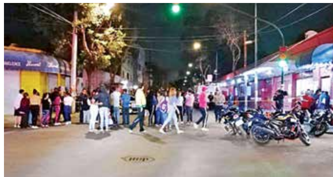
El ataque a la joven fue en la calle Ernesto Elorduy, en Peralvillo; dos hombres en motocicleta le dispararon y huyeron.