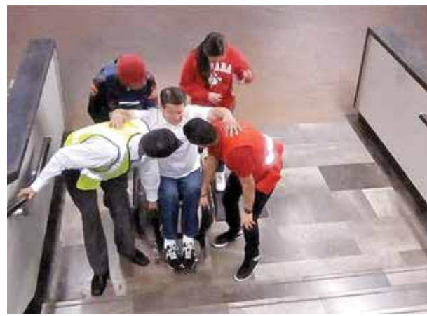
Mientras se realizan las labores de mantenimiento en las escaleras, personal del Metro auxilia a quienes lo requieren.