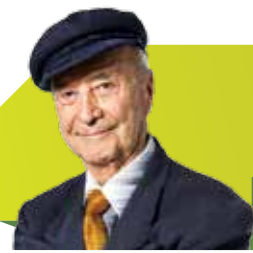
Viejo mi querido viejo

estimó hacer modificaciones en 100 intersecciones, por lo que en los primeros 100 días de gobierno han completado más de la tercera parte de avance.