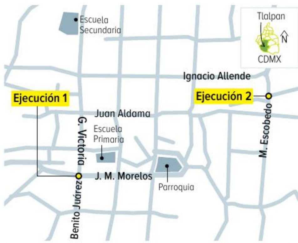
Gráfico: Abraham Cruz

Los dos homicidios fueron cometidos a 800 metros de distancia. Investigaciones policíacas señalan que minutos antes del delito un auto azul seguía a las víctimas.