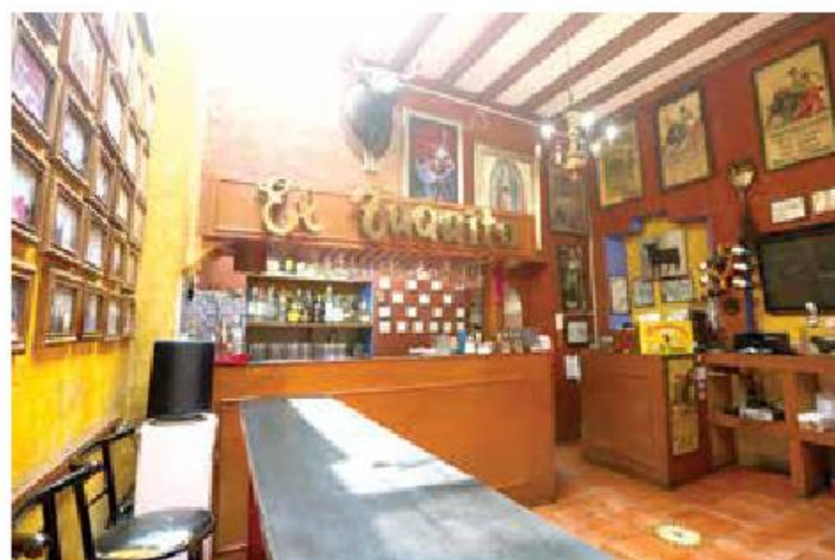
El restaurante dedicado a la vida taurina celebró 104 años, esperando que la clientela se incremente.

"Éramos 32 personas, pero como el Taquito es tan viejo, muchos se retiraron