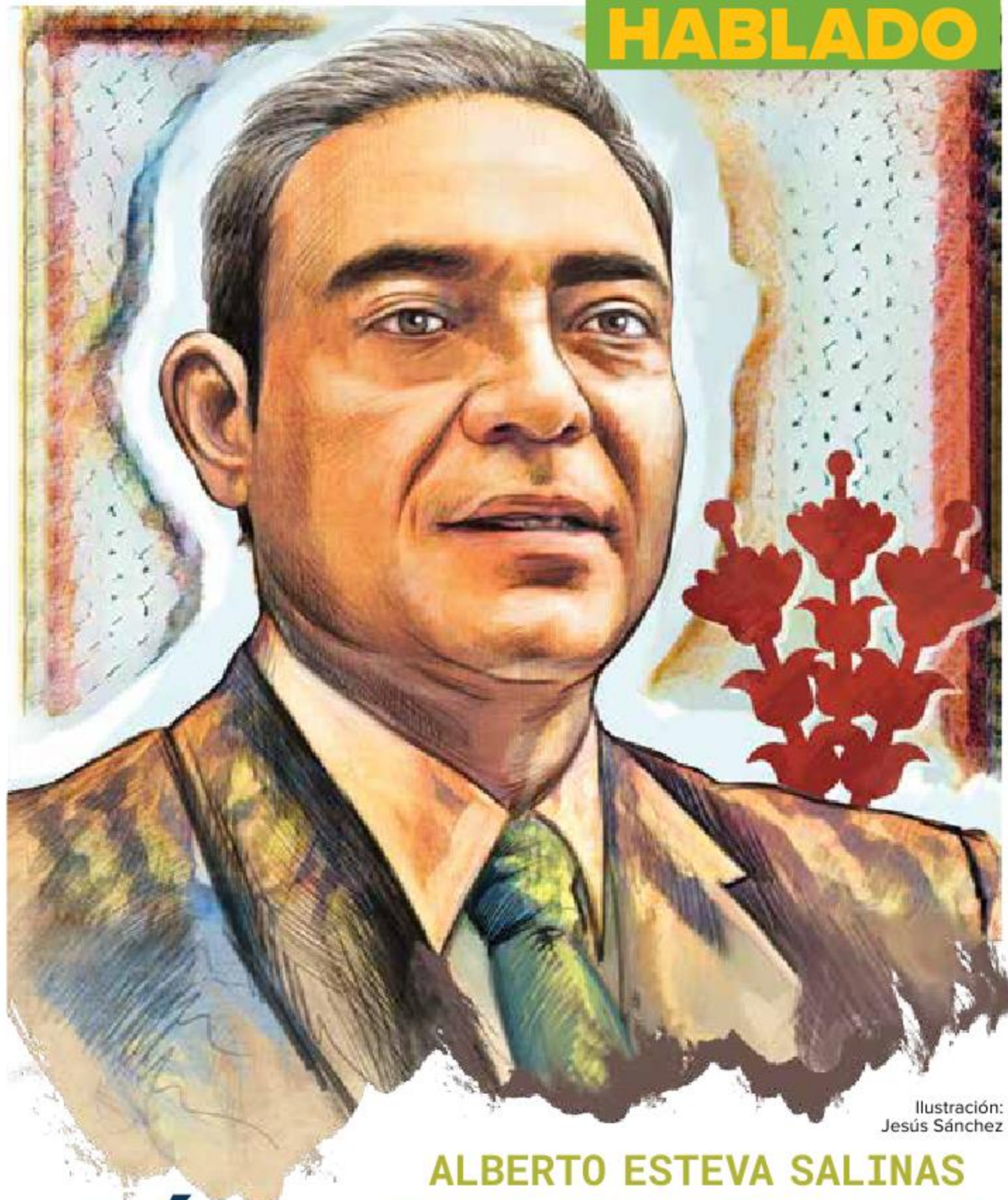
Ilustración: Jesús Sánchez