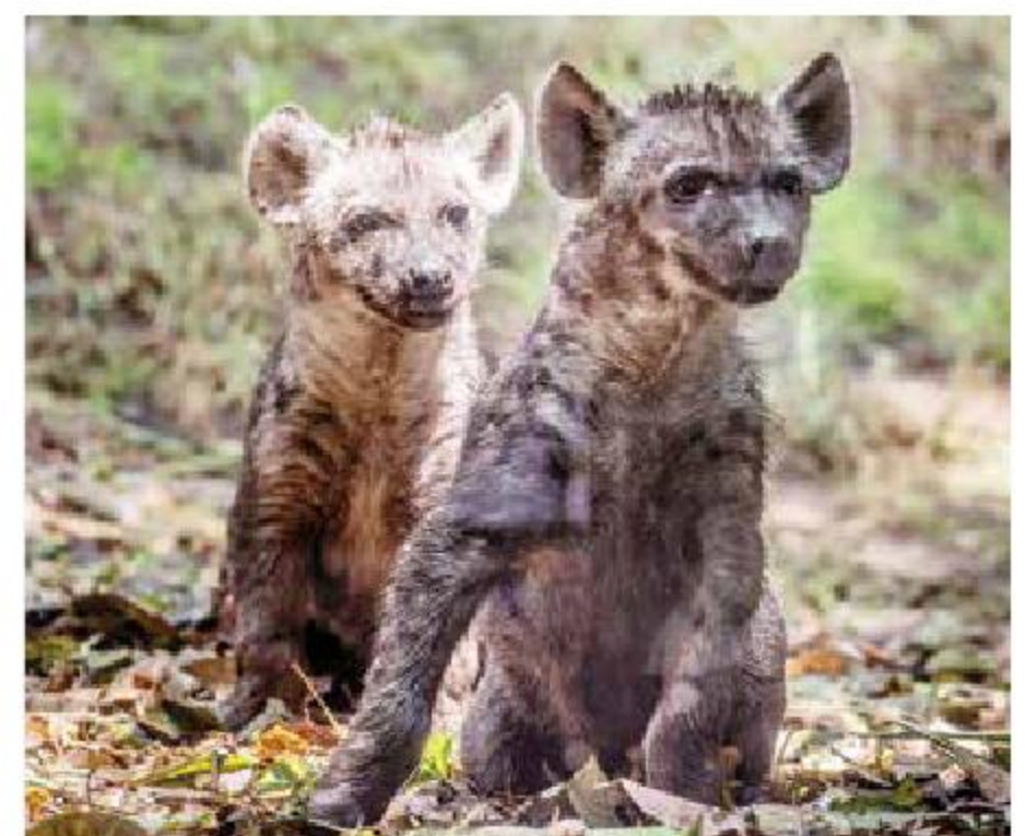
MAKENA Y OMONDI

Uno de los guardias de la vivienda quedó también bajo custodia, junto con su arma de cargo.