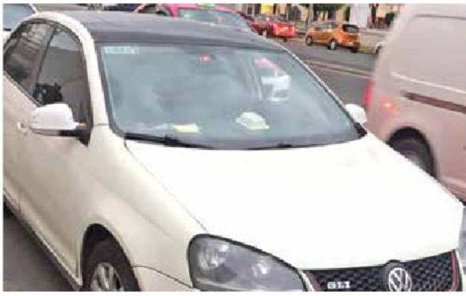
Los cuatro hombres relacionados con el grupo delictivo La Unión Tepito viajaban en un Golf blanco con matrícula C18-AZD.

Cuatro sujetos, integrantes de La Unión de Tepito fueron detenidos anoche por elementos de la Secretaría de Seguridad Ciudadana.