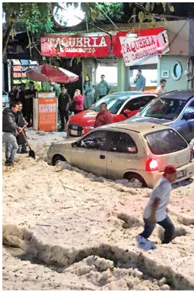
En Prolongación Bosques, en la delegación Cuajimalpa, una gran cantidad de granizo afectó el traslado de vehículos y peatones.

En Tláhuac, se registraron al menos cuatro inundaciones que requirieron la atención bomberos, Protección Civil y del Sistema de Aguas. Una de las inundaciones ocurrió en el cruce de las calles Reforma Agraria y San José en la colonia La Habana. Otra, en Juventino Rosas y