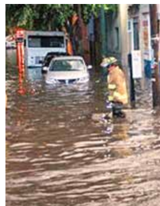
En Tláhuac se registraron al menos cuatro inundaciones.

reportaron dos bajadas intensas de agua y una inundación. Una bajada ocurrió en Monte Naranjo y Ahuehuetes, otra en Jesús del Monte y Monte Encino. Una inundación en la carretera México-Toluca y San José de los Cedros.