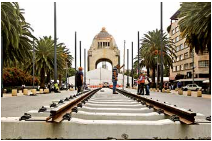
PLAZA DE LA REPÚBLICA