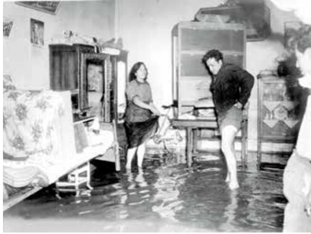
Al desbordarse, el Río de la Piedad causaba inundaciones.

“Limpieza de lagos, ríos y caudales. Tenemos que atrevernos a pensar diferente. En este mismo siglo alguien que compitió por el gobierno de Seúl. Corea (del Sur), prometió tirar segundos pisos y reabrir ríos. Ganó y lo hizo.