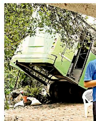
La unidad impactó a su paso árboles, postes y una barda.

"Está aquí la aseguradora del camión, que es la responsable de dar los pases médicos. Viene en camino el gerente de siniestros para hacerse responsable de