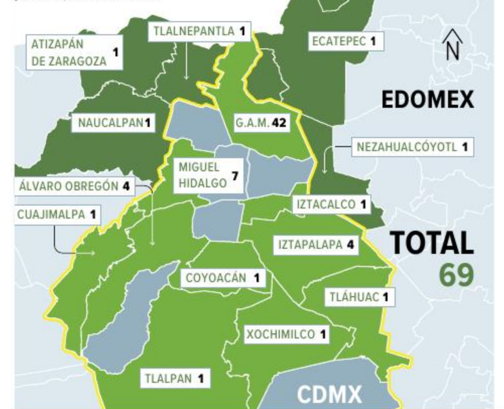
Gráfico: Arte staff

Número de casos de sarampión por alcaldía y municipio del Edomex: