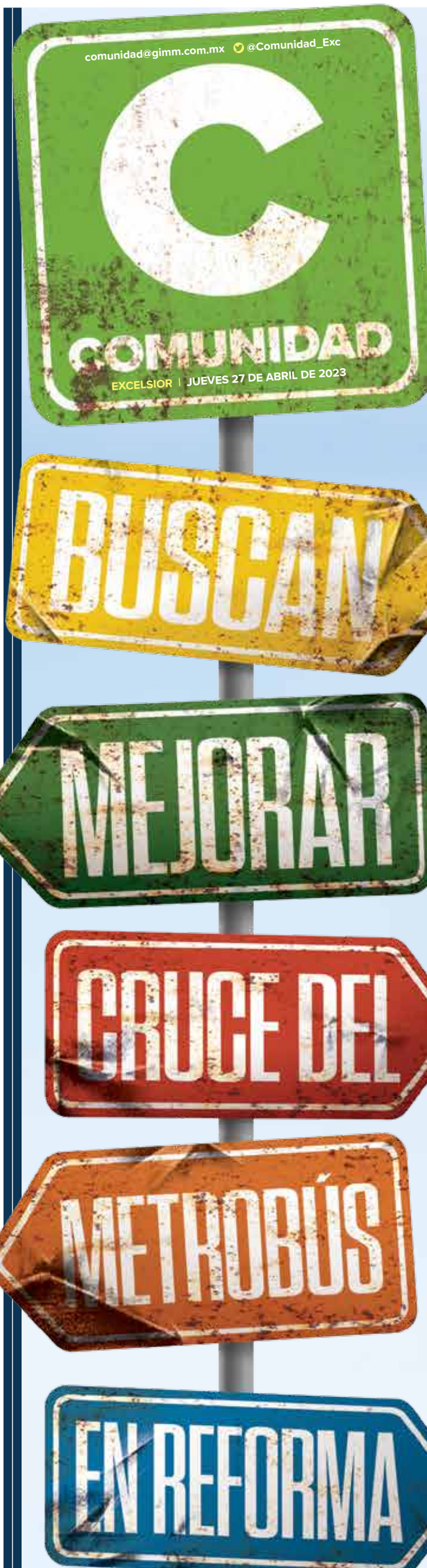
Fotoarte: Horacio Sierra