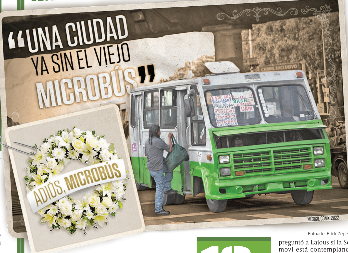
Fotoarte: Erick Zepeda