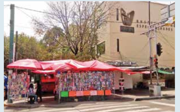
En Dr. Márquez y Cuauhtémoc se instala un puesto que invade la banqueta y el paso peatonal por la cebra.

Integrantes de la Comisión de Participación Comunitaria y del Comité Fundacional de la Asociación de Residentes de la Colonia Hipódromo consideraron que es indispensable abordar temas como derecho al trabajo, pero también derechos del peatón, así como medidas sanitarias contra covid-19, de protección civil y seguridad ciudadana.