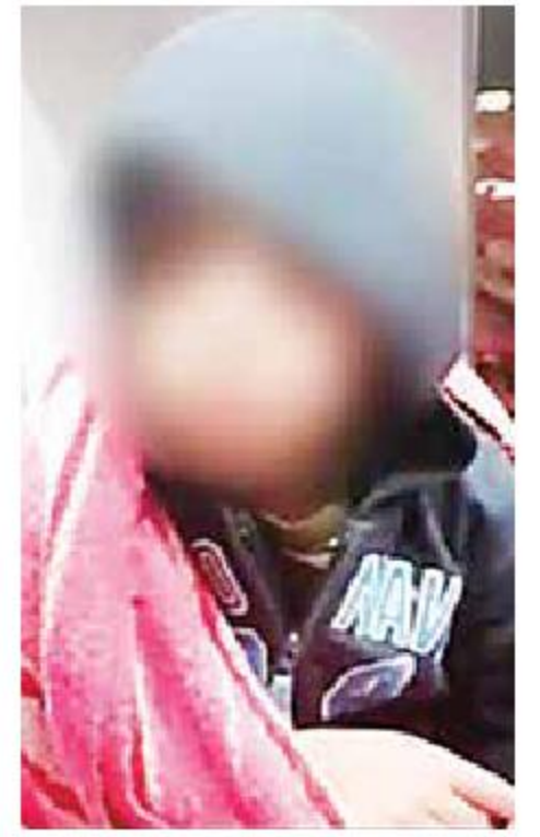
Itan Alfonso refirió que lo dejaron en la calle porque ya no quería su papá y su madrastra.

En tanto, la Fiscalía General de Justicia de la Ciudad de México informó que inició una investigación por el delito de violencia familiar en contra del padre del menor y la madrastra.