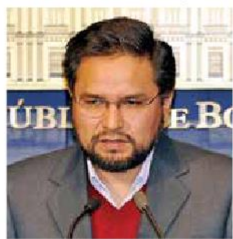
El exministro Rada Vélez.

De acuerdo con reportes policiales preliminares, el ministro de Gobierno boliviano de 2007 a 2010 y ministro de la Presidencia de 2018 a 2019 decidió salirse de la tienda de autoservicio con los productos, pero personal de seguridad lo detuvo y solicitó la intervención de la Policía Preventiva.