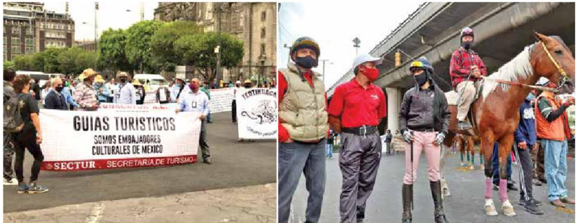
CERRARON VARIAS CALLES

La cremallera cerrada está ubicada sobre la calle Plan de Ayala, y se pintó diagonalmente para indicar la reparación de la grieta.