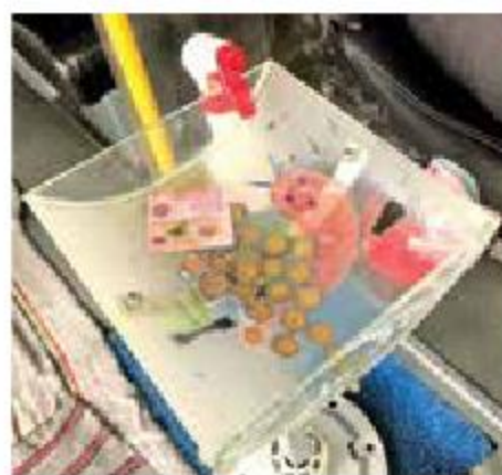
La "charolita sanitizadora" en la que deposita monedas y billetes.

Pero una botella de un litro de gel sanitizante le cuesta 150 pesos, más otro tanto