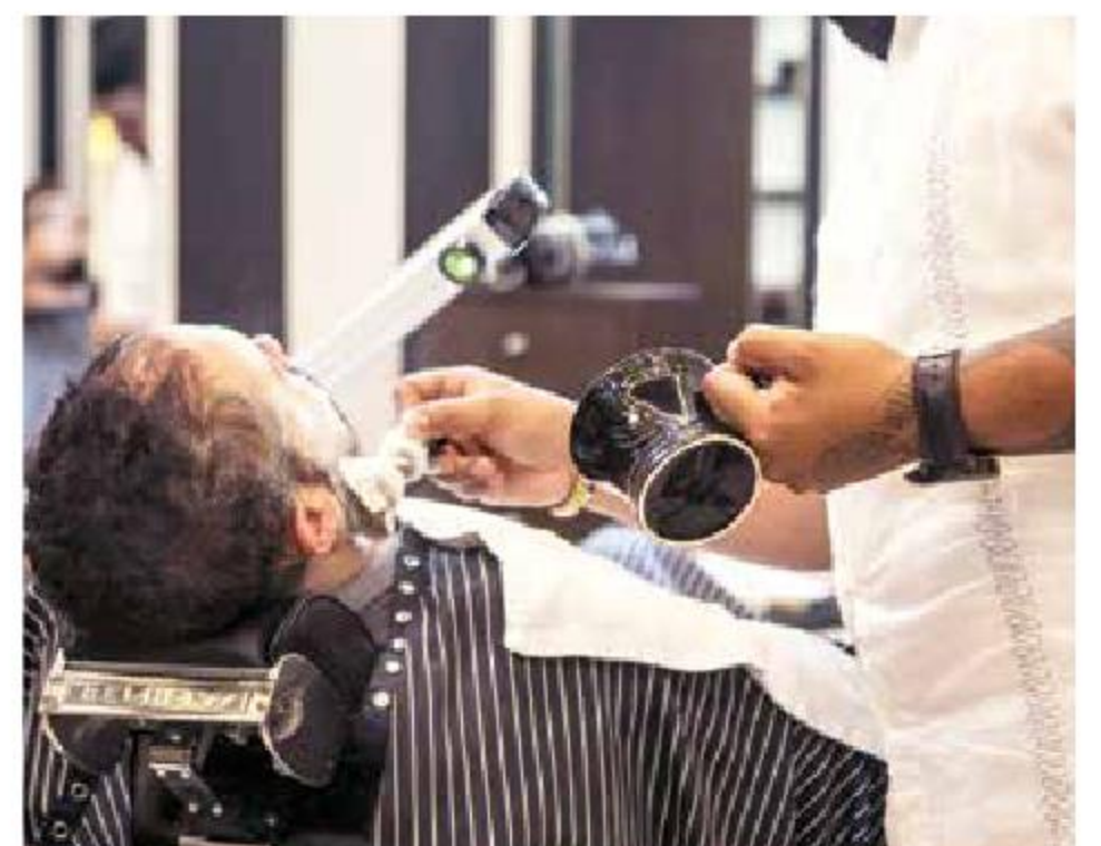
Los equipos a usar se deben desinfectar luego de atender a un cliente, y se debe usar mascarilla y cubreboca durante la atención.

También deben implementar el constante de gel antibacterial 70 por ciento alcohol y se impide la interacción cara a cara entre usuarios y trabajadores, con barreras físicas entre las personas a la altura de la cara.