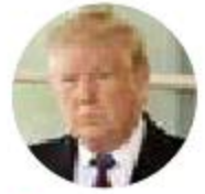
• Donald Trump, presidente de EU.

Sin los empresarios mexicanos, el encuentro López Obrador-Trump adolece de la falta de sustancia real en el asunto del T-MEC. Adicional a ello, México manda, desde ahora, una señal de mucha debilidad y poca confianza. Si el gobierno no invita a los empresarios nacionales, qué pueden esperar las compañías internacionales, máxime cuando se han dado señales muy negativas, como la cancelación de la planta de Constellation Brands y el último episodio de Iberdrola, en cual se está por cancelar una planta de energía eléctrica en Tuxpan.