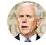
• Mike Pence, vicepresidente de EU.

Hace un par de semanas, el vicepresidente Mike Pence escribió en el WSJ que no habría una segunda ola de covid-19. La realidad en muy poco tiempo lo desmintió.