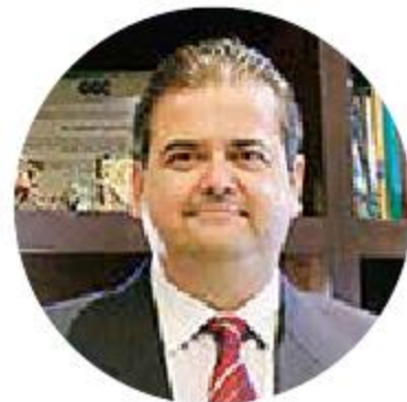
Reginaldo Esquer, presidente de la Comisión Nacional Fiscal

Para los montos superiores, las devoluciones deben ser en un plazo no mayor a 30 días. Con ello se daría liquidez a las empresas que