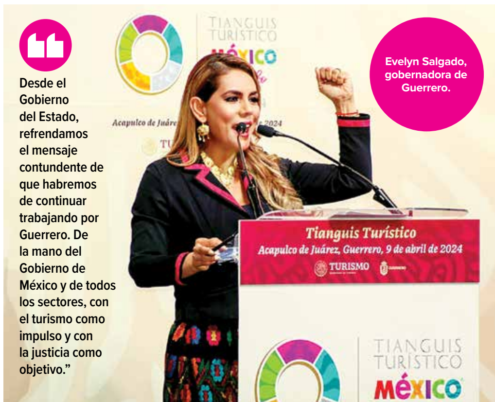
Evelyn Salgado, gobernadora de Guerrero.