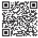
Más trabajos del columnista en su sitio de LinkedIn

No estamos en Dinamarca y también es cierto que, con los trámites en línea, en ciertas instancias se ha mejorado mucho el tiempo de respuesta.