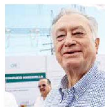
Manuel Bartlett, director de la CFE.

Durante la transmisión de un video para conmemorar el 83 aniversario,