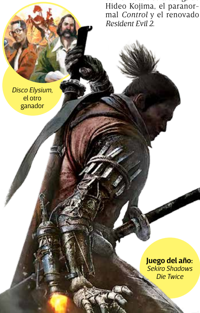
Disco Elysium, el otro ganador