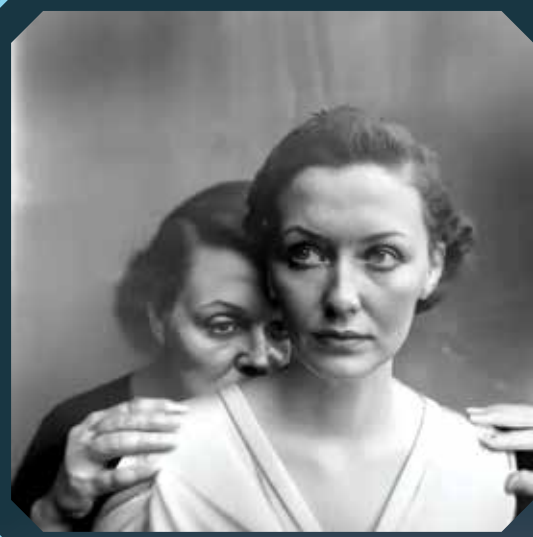
Foto hecha con IA, ganadora en el Sony World Photography, de Boris Eldagsen. Rechazó el premio.