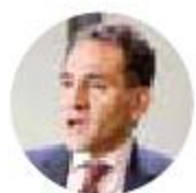
Arturo Herrera, secretario de Hacienda.

El secretario Herrera no se ha convertido en un villano, a ello también contribuye que el ego no sea el resorte que lo mueve.