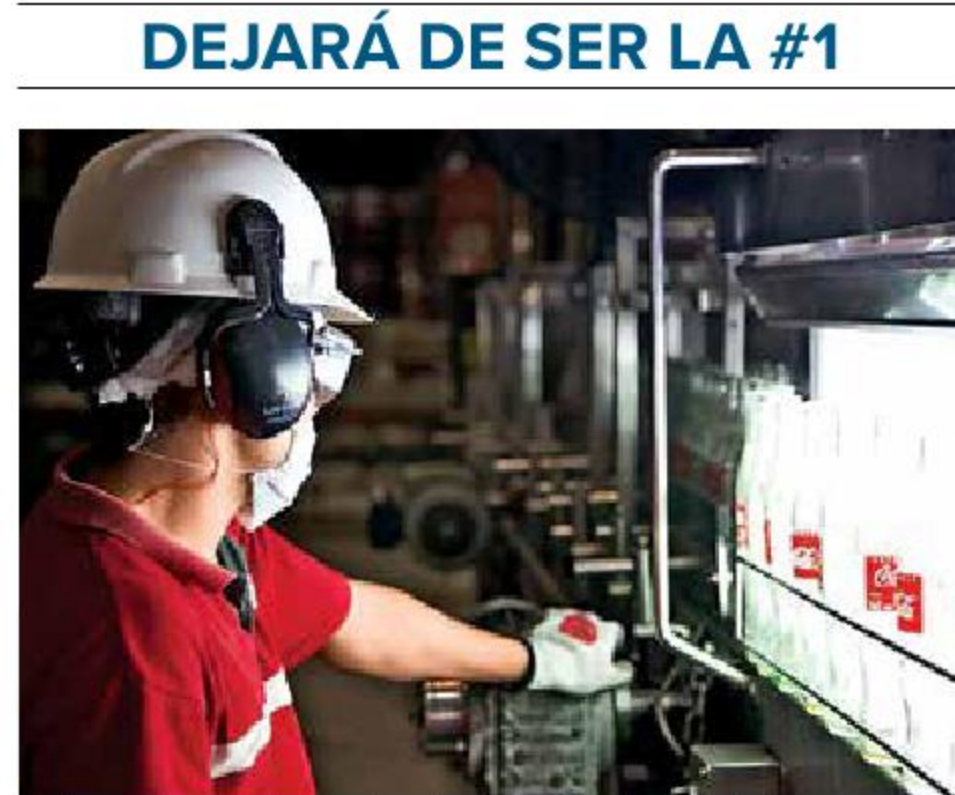
La producción de botellas de KOF se ha visto a la baja.