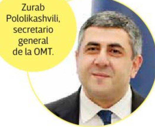
Zurab Pololikashvili, secretario general de la OMT.

El documento precisa que después de la reapertura gradual de las fronteras internacionales, Europa tuvo impactos menores en julio y agosto de -72% y -69%, respectivamente, sin embargo, el efecto duró poco debido a que volvieron las recomendaciones y las restricciones de viaje, así como el aumento de los contagios. Mientras que en el otro extremo, Asia-Pacífico registró las mayores caídas, con un -96% en ambos meses luego de que China y otros importantes destinos de