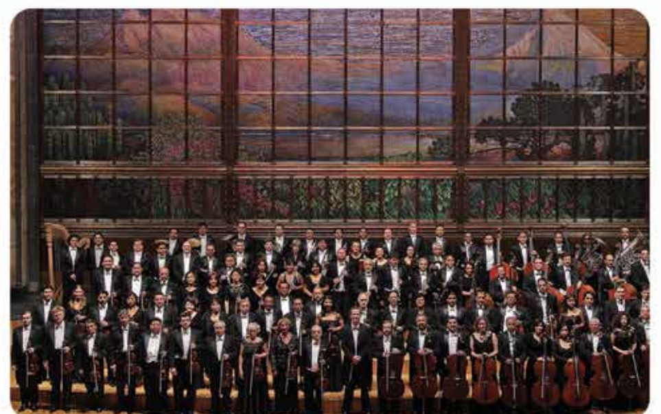
Orquesta Sinfónica Nacional