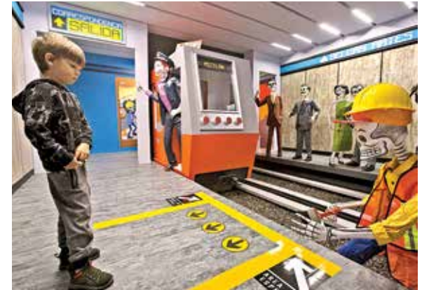
Cada obra cuenta con una fotografía y datos de su creador.