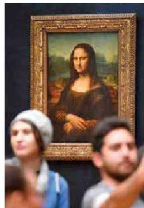
El famoso lienzo de Da Vinci, joya del célebre recinto parisino.

La visibilidad sobre La Gioconda , protegida en una urna transparente, se mejoró gracias a la instalación de