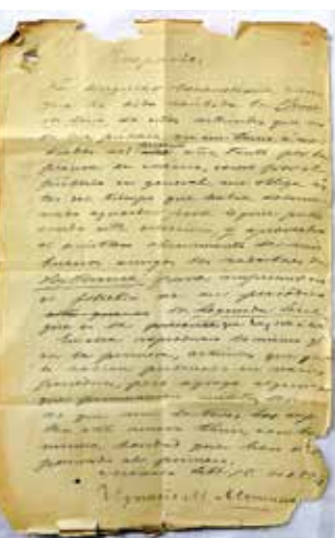
El manuscrito permaneció oculto dentro de un ejemplar de Rimas , de Altamirano.

recibida la primera serie de estos artículos que vio su luz pública en un tomo, a mediados del presente año, tanto por la prensa de México, como por el periódico en general, me