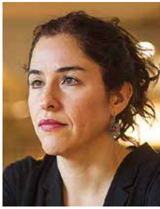
Nettel es la única latinoamericana.

Nettel es la única latinoamericana en la selección, que incluye a la catalana Eva Baltasar, la guadalupeña Maryse