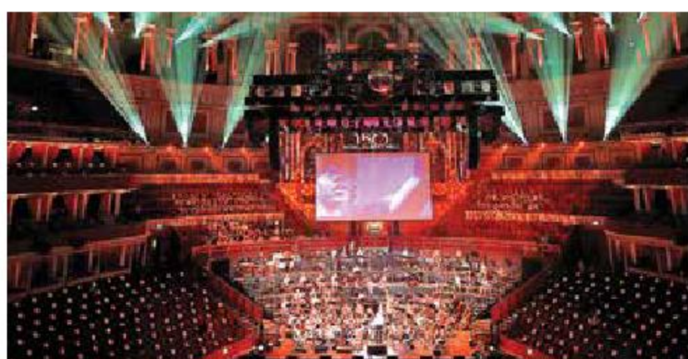
ROYAL ALBERT HALL