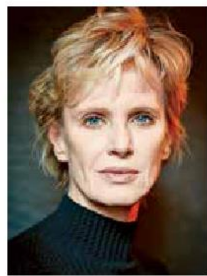
Siri Hustvedt, en charla virtual.