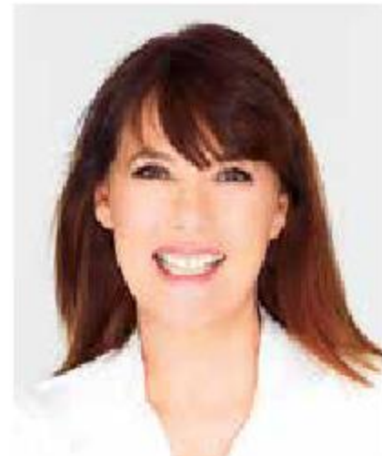
La cineasta Mabel Lozano.

Por su parte, la escritora española María Dueñas presentará su más reciente novela, Sira (Editorial Planeta), el 25 de julio a las 12:00 horas.