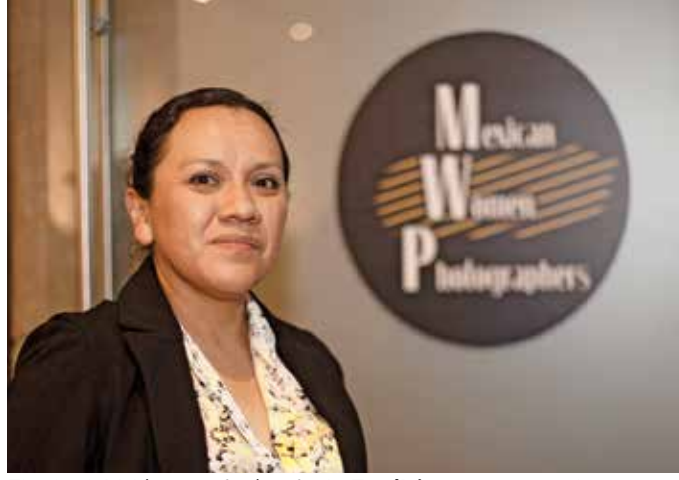
Elizabeth Velázquez, fotógrafa de Excelsior , participa en la exposición colectiva con una gráfica sobre la lucha libre.