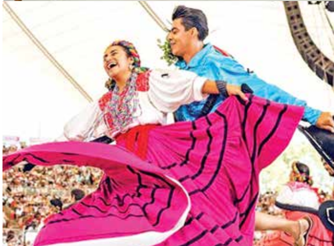
Ezequiel Apolinar Chávez informó que se observará originalidad, veracidad, trascendencia y contenido de las propuestas escénicas.

expresión artística y cultural que se manifiesta en la región del Valle de Oaxaca”.