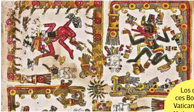
Los códices Borgia, el Vaticano B y el Vaticano 3738 integrarían una muestra.